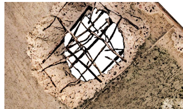
Bild: Das vom Verfassungsschutz in ein Gefängnis gesprengte „Celler Loch“. Es sollte der Eindruck erweckt werden, als sei dieses von Terroristen organisiert worden.

Unklar ist auch, inwieweit das aus guten Gründen zur deutschen Rechtspraxis gehörende Trennungsgebot zwischen Nachrichtendiensten und Polizei tatsächlich überhaupt noch eingehalten wird.