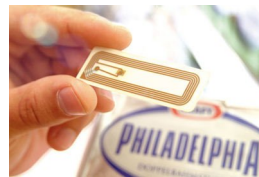
BILD: RFID-Chip an einem Lebensmittel

Hier einige übliche Anwendungsbeispiele: