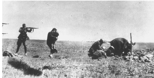
Bild: Erschießung jüdischgläubiger Menschen in der Ukraine, 1942

Während des Zweiten Weltkrieges von 1939 bis 1945 übernahm die „Gestapo“ vielfach die Organisation und Durchführung von Verfolgung, Deportation, Ermordung und Massenvernichtung von Juden, Intellektuellen, Oppositionellen, Andersgläubigen, Minderheiten und Homosexuellen in den von Deutschland besetzten Gebieten Europas.