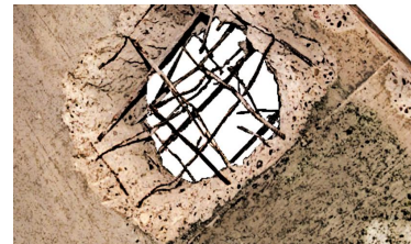
Bild: Das vom Verfassungsschutz in ein Gefängnis gesprengte „Celler Loch“. Es sollte der Eindruck erweckt werden, als sei dieses von Terroristen organisiert worden.

Unklar ist auch, inwieweit das aus guten Gründen zur deutschen Rechtspraxis gehörende Trennungsgebot zwischen Nachrichtendiensten und Polizei tatsächlich überhaupt noch eingehalten wird.